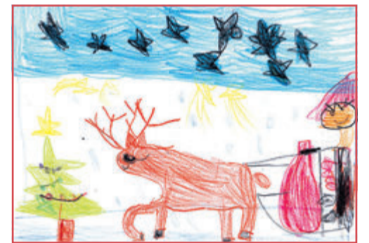
Emiliy, 7 Jahre