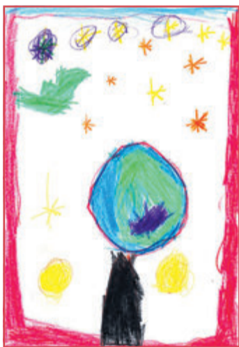
Jelena, 7 Jahre