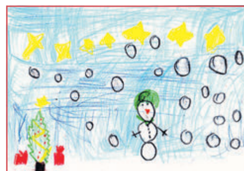
Sham, 7 Jahre