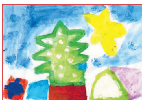
Levke, 6 Jahre