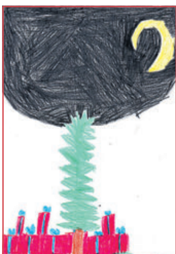
Luca, 6 Jahre