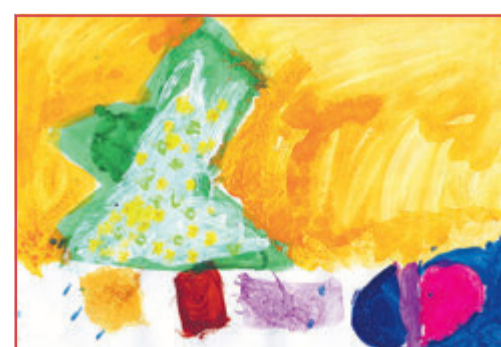
Rike, 6 Jahre