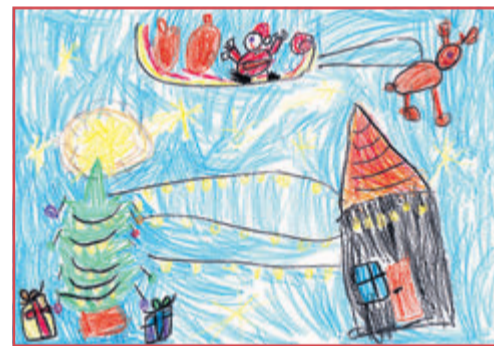
Elsa, 6 Jahre