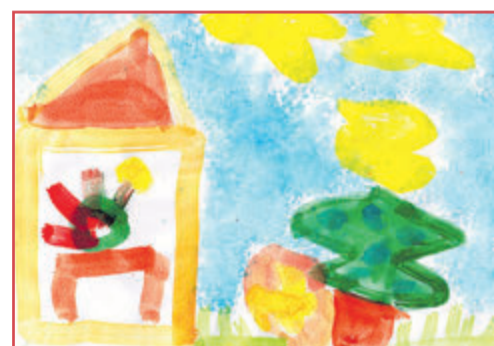
Hinrich, 7 Jahre