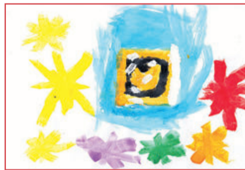
Dominiky, 7 Jahre